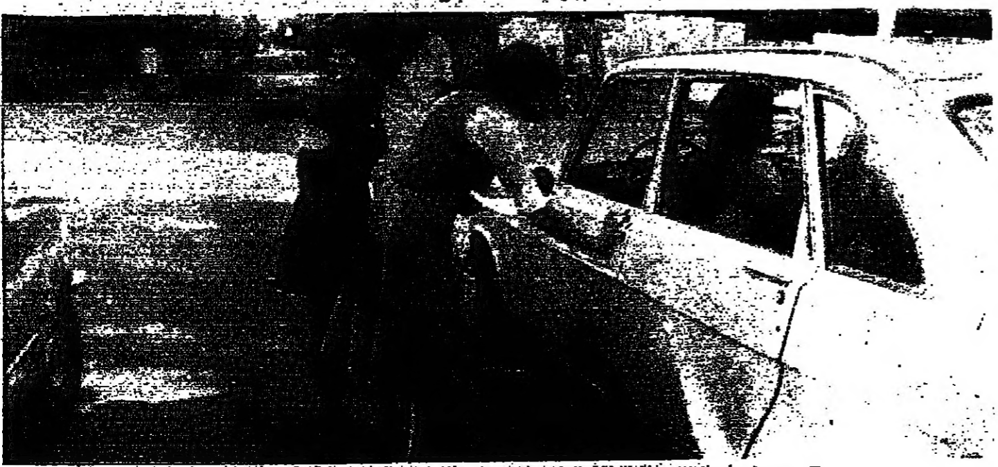
■ جمع تبرعات لتفاز حملة النظافة والتنظيم في منطقة وادي بيروت ■